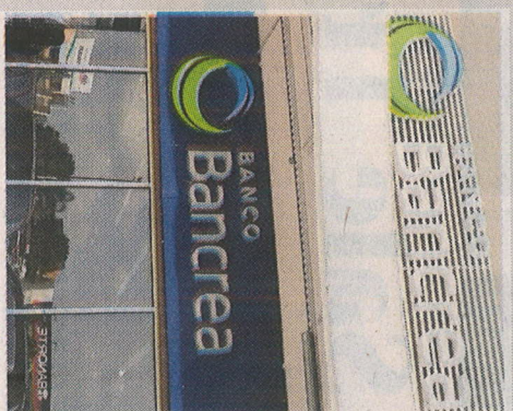
Bancrea ha crecido hasta ser un banco

El presidente del Consejo señaló que a pesar de la incertidumbre en materia económica que se vive actualmente en el país, Bancrea tuvo el año más "agresivo" en su